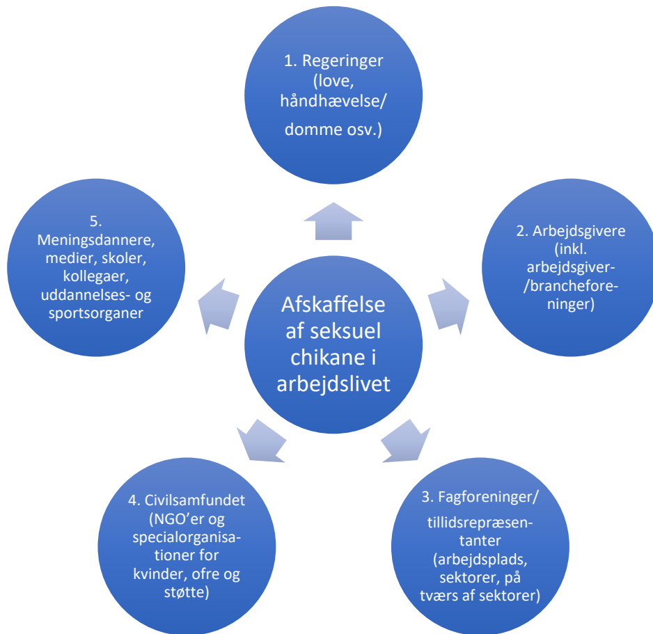
Figur 2: Aktører, som spiller en rolle i afskaffelsen af seksuel chikane i arbejdslivet