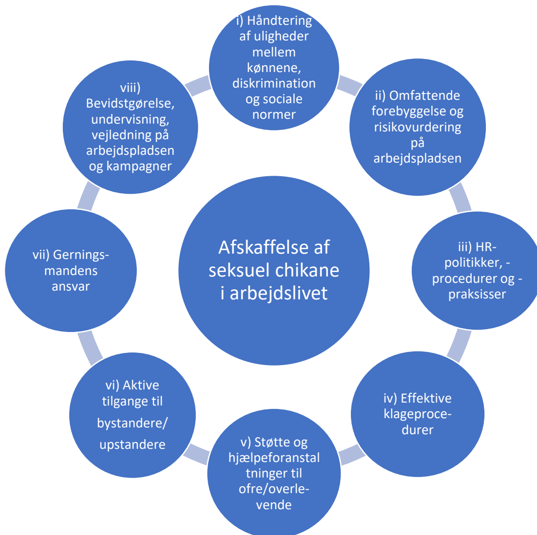
Figur 3: ASTRAPI's rammer for en transformativ tilgang til afskaffelse af seksuel chikane på arbejdspladsen

Dette afsnit gennemgår i detaljer de otte punkter i ASTRAPI-projektets ramme for en transformativ tilgang til afskaffelse af seksuel chikane i arbejdslivet (figur 3). At fremme et lige, imødekommende, værdigt og ikke-kønsdiskriminerende arbejdsmiljø bidrager til at fremme lighed mellem kønnene og ikke-diskrimination, gode arbejdspladsrelationer, teamwork mellem kollegaer og højere niveauer af innovation og tilfredsstillelse på arbejdspladsen.